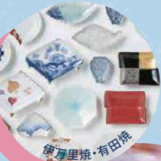
伊万里焼・有田焼