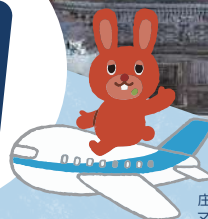
庄内空港ビル側 マスコットキャラクター まめうさぎ