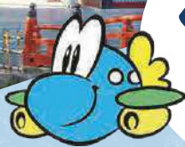
九州佐賀国際空港 キャラクター むっぴー