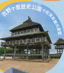
吾野ヶ里歴史公園