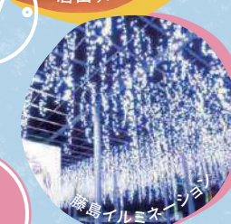
藤島イルミネーション